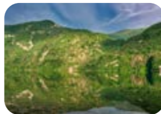
ELENA MADDALOZZO La sottile linea Lago del Corlo