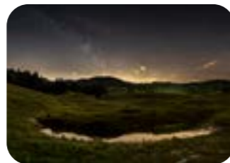
IVAN BOF La pace dei sensi località Bocchette, Seren del grappa