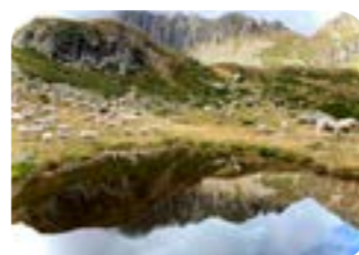
FEDERICA STROPPA Uno specchio perfetto Sasso Rotto riflesso nel lago d'Ezze