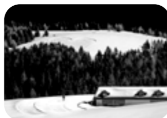
GIORGIO COLETTI Bello da lasciarci il cuore Brocon

Con tutte le foto selezionate dal Concorso Fotografico "Paesaggi Montani" è disponibile in due versioni, da muro e da tavolo.