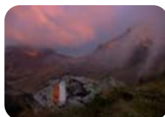
SEBASTIANO MONTIBELLER Sentiero all'alba Passo Val Cion