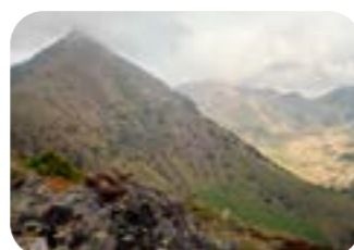
MIRKO FRUET La vipera e cima Ziolera dorsale Cima Valsolero