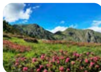
GIULIA AGOSTINI Fioritura dei rododendri sul Lagorai Zona malga Casapinello