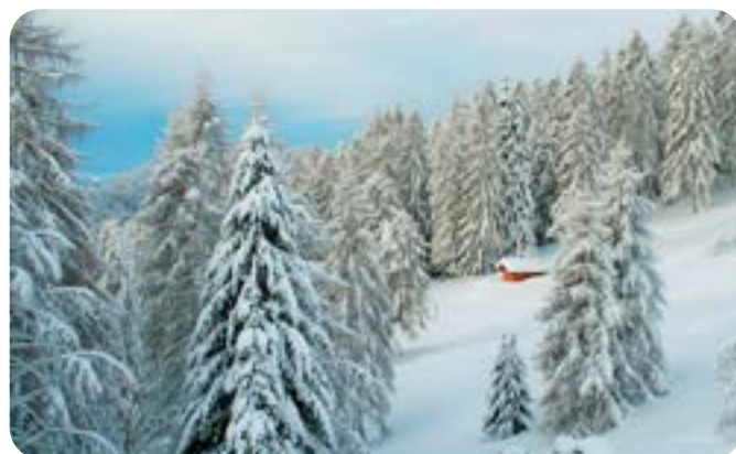
2° CLASSIFICATO - RICCARDO TRENTIN PAESAGGIO INNEVATO - LOCALITÀ DESENE