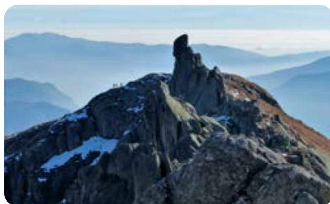
3° CLASSIFICATO - FABIOLA CAUMO L'ATTESA - IL FRATE - LAGORAI