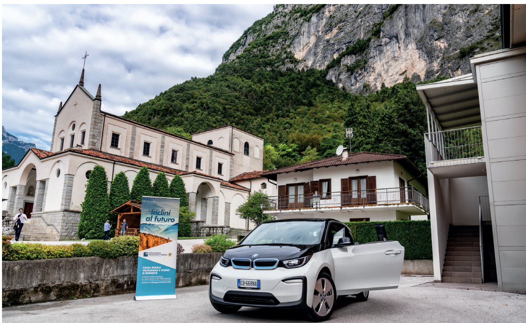
L'auto vinta dalla cliente della Cassa Rurale Valsugana e Tesino con il concorso di CCB