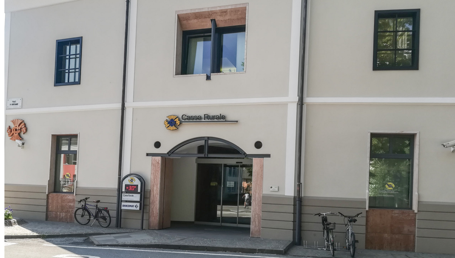
LA SEDE DELLA CASSA RURALE VALSUGANA E TESINO A BORGIO VALSUGANA