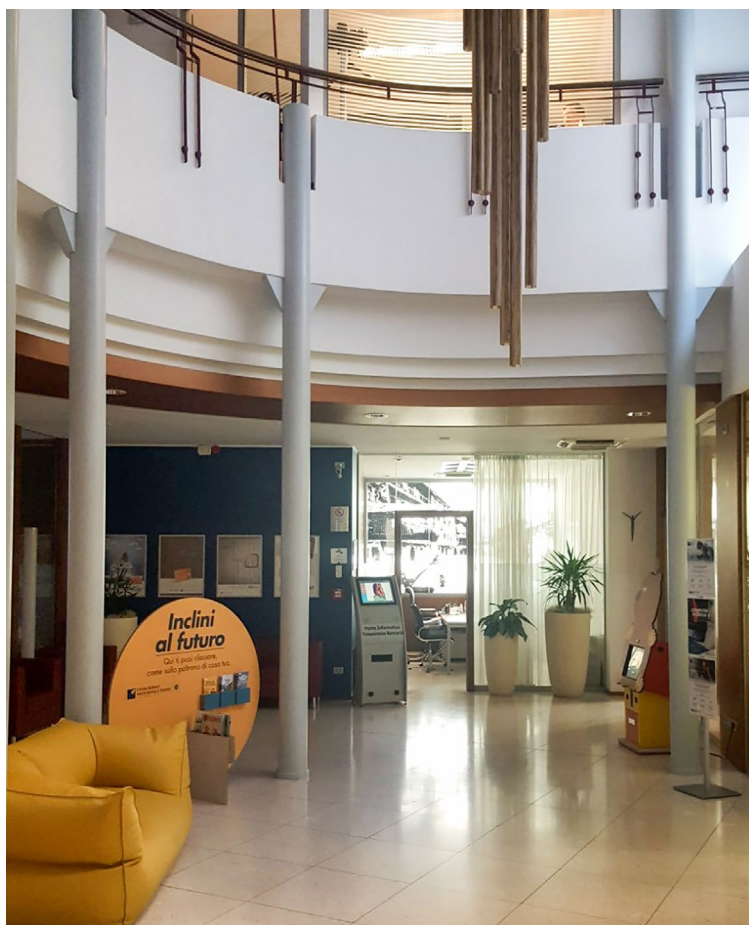
Cassa Rurale Valsugana e Tesino, sede di Borgo Valsugana

«Certo, per poter risolvere tutti questi problemi c'è bisogno, oltre che delle nostre competenze, anche dell'aiuto di ditte esterne