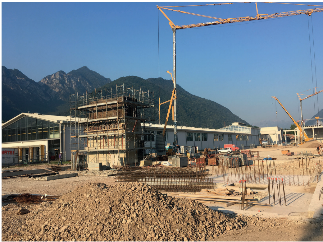
I lavori per l'ampliamento dello stabilimento Finstral di Borgo Valsugana

«Grazie a questo impianto Finstral ora sarà anche in grado di nobilitare direttamente le superfici in alluminio. La realizzazione di un nuovo impianto per la verniciatura a polvere è un ulteriore passo verso il nostro obiettivo di realizzare direttamente più componenti possibili dei nostri serramenti», afferma Florian Oberrauch, membro della direzione Finstral. «Con questo investimento rispondiamo ad una richiesta di mercato in forte crescita, ovvero