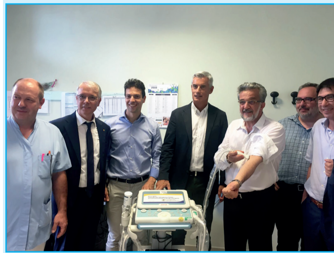
Un momento della consegna del nuovo ecografo all'Ospedale S. Lorenzo

BORGO VALS. ►►► Buone notizie per i pazienti in emodialisi della Bassa Valsugana. L'8 agosto scorso, infatti, la Cassa Rurale Valsugana e Tesino ha provveduto a consegnare al Servizio di emodialisi dell'Ospedale San Lorenzo di Borgo Valsugana un nuovo ecografo che permetterà al personale medico di valutare la condizione clinica dei pazienti con maggiore precisione, grazie alla possibilità di monitorare eventuali versamenti, lo stato dei reni e più in generale la situazione degli organi addominali. Sarà possibile individuare con più facilità dove fare la venipuntura e adottare la tecnica migliore, in modo da aumentare la durata degli accessi vascolari.